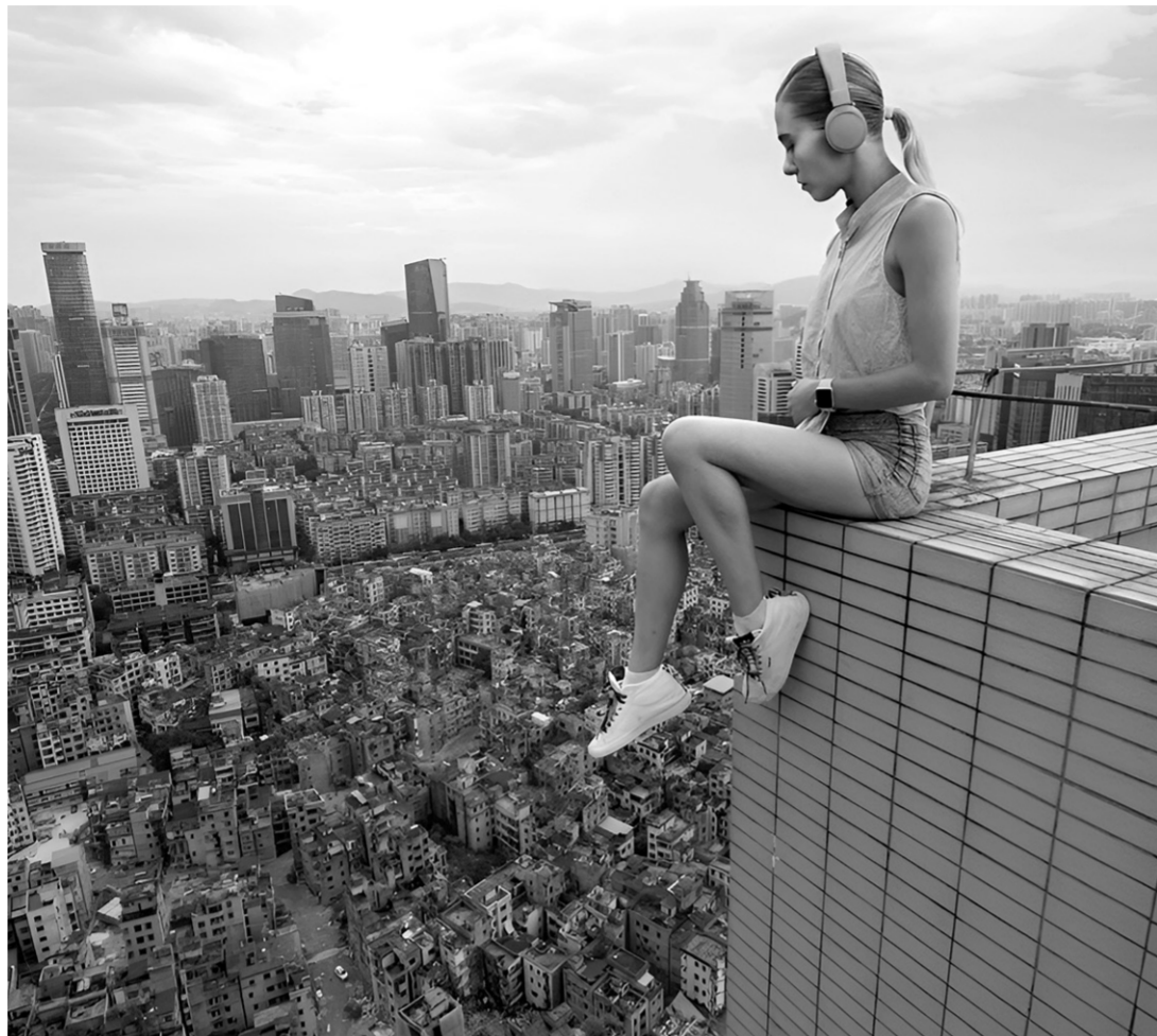
Не стоит рисковать ради шикарного снимка — это может закончиться плачевно

Планируя поездку, выделите хотя бы пару дней для акклиматизации. Особенно это важно при смене климатических поясов и большой разнице во времени. Проживать лучше в местах, обеспеченных централизованным водоснабжением и канализацией. Если вы обнаружили в номере комаров, блох или грызунов, немедленно поставьте в известность администрацию и настоятельно попросите их принять срочные меры по уничто-