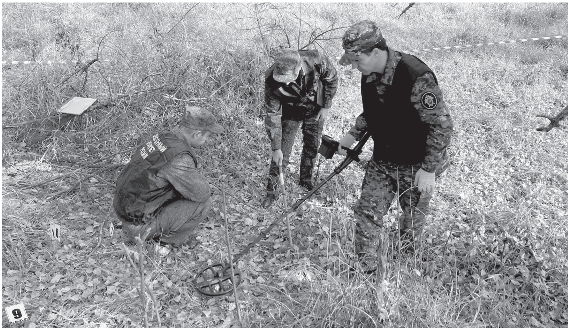
Следователи исследуют каждый сантиметр на месте преступления в поисках улик

— Руководством ведомства уделяется особое внимание вопросам предупреждения, выявления и расследования преступлений коррупционного характера.