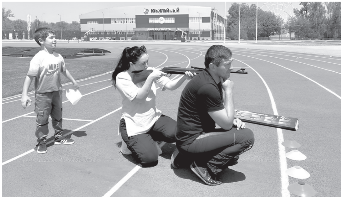
Главное при сдаче ГТО — поддержка всех членов семьи

Участие в соревнованиях допускались семейные команды, возраст участников — от 7 до 69 лет. Команды формировались