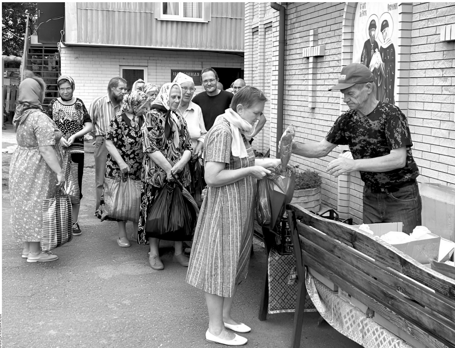
Раздача гуманитарной помощи из КЧР в Свято-Николаевском храме города Первомайск, ЛНР