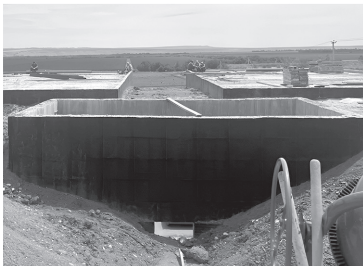
После проведения пусконаладочных работ запустят в действие

Карачаевский групповой водопровод строится для нужд трех муниципалитетов КЧР, а это сразу 11 населенных пунктов Карачаевского и Усть-Джегутинского районов плюс Карачаевский городской округ. Работы здесь